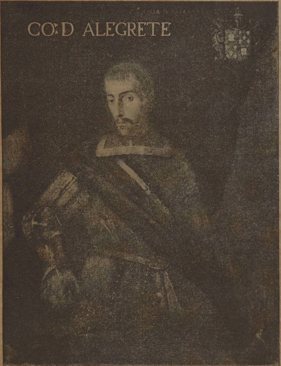
O MESTRE DE CAMPO GENERAL MATHIAS DE ALBUQUERQUE.