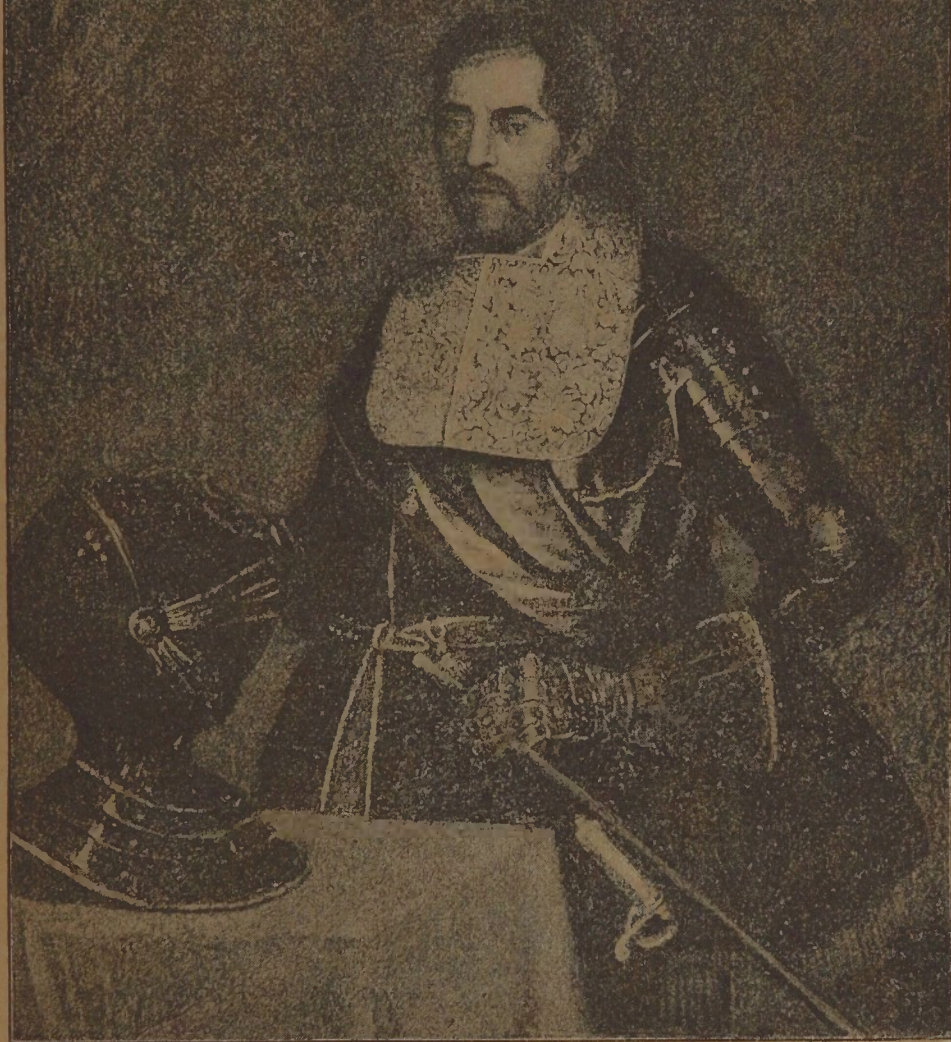
O MESTRE DE CAMPO GENERAL FRANCISCO BARRETO DE MENEZES.