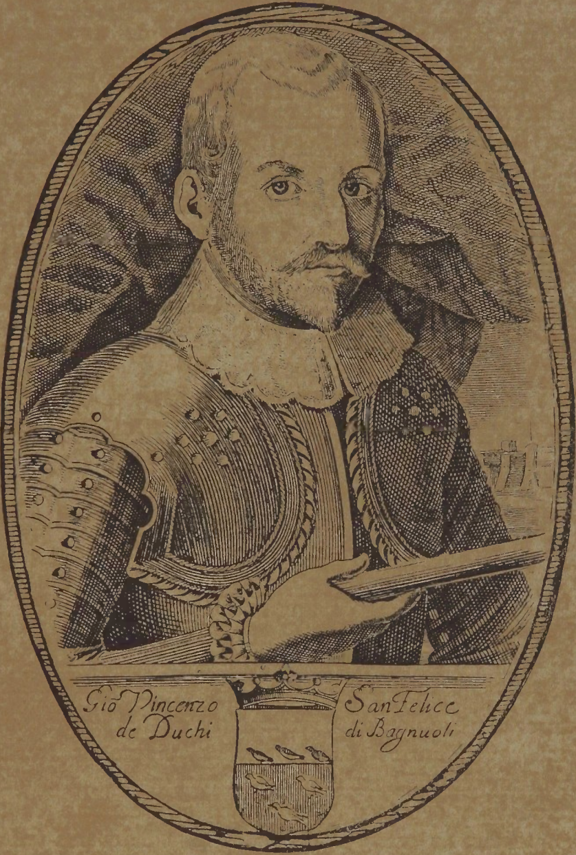
O MESTRE DE CAMPO GENERAL PRINCIPE DE BAGNUOLI.