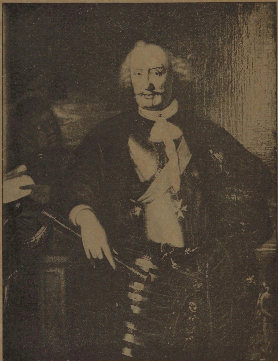
JOÃO MAURICIO, CONDE DE NASSAU-SIEGEN GOVERNADOR DO BRAZIL HOLLANDEZ.