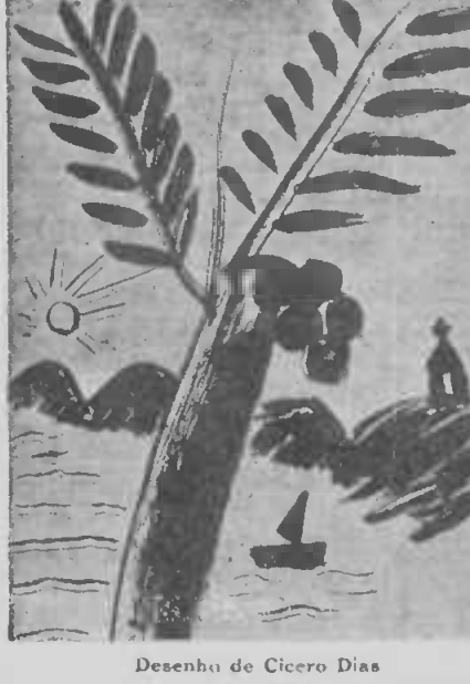
Desenho de Cicero Dias

Essa noticia fô recebida com entusiasmo entre os adeptos da "Antropofagia", que são muito numerosos nesto capital.