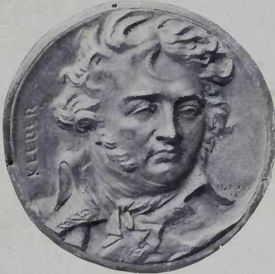
Retrato do General Kleber, medalhão de bronze de David d'Angers

E o escriptor japonez conclue pedindo que se di-