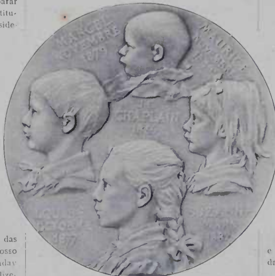
Os filhas do artista, medalha de J. C. Chaplain