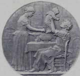
Trabalho do trabalhador, medalha de J. C. Chaplain

O que dinnha este adorador de ídolos se soubesse o que em nome da justiça divina e da doutrina do Evangelho, igualmente invocadas pelos dois campos inimigos, se está praticando na Africa Anstral?