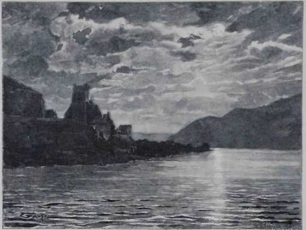
S. MIGUEL NO DONAU