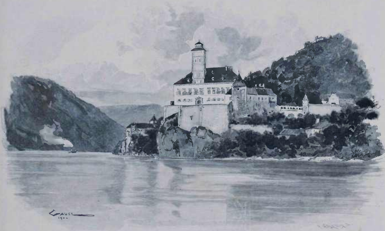
CASTELLO SCHONBUHEL NÓ DONAU