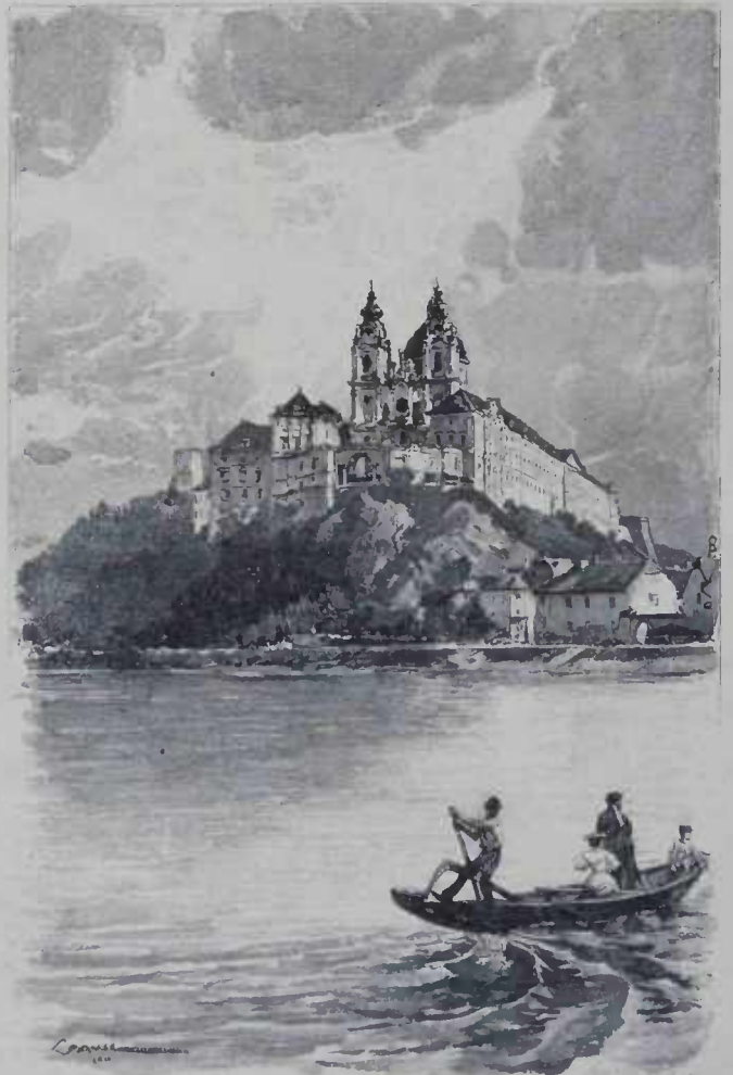
CONVENTO MOKK NO DONAU

É um animal naturalmente docil, facil de governar, soffredor e manso. O bom tratamento e principalmente a musica e o canto excitam-no a empregar todos os esforços para contentar o seu dono. Torna-se, porém, teimoso e intratavel quando é castigado brutalmente, e allina-se que é difficil evitar a sua vingança.