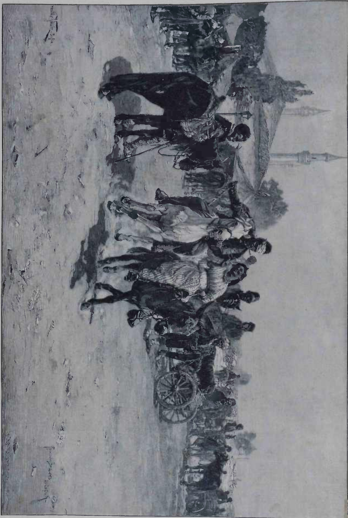
MERCADO DE CAVALLOS NO ORIENTE