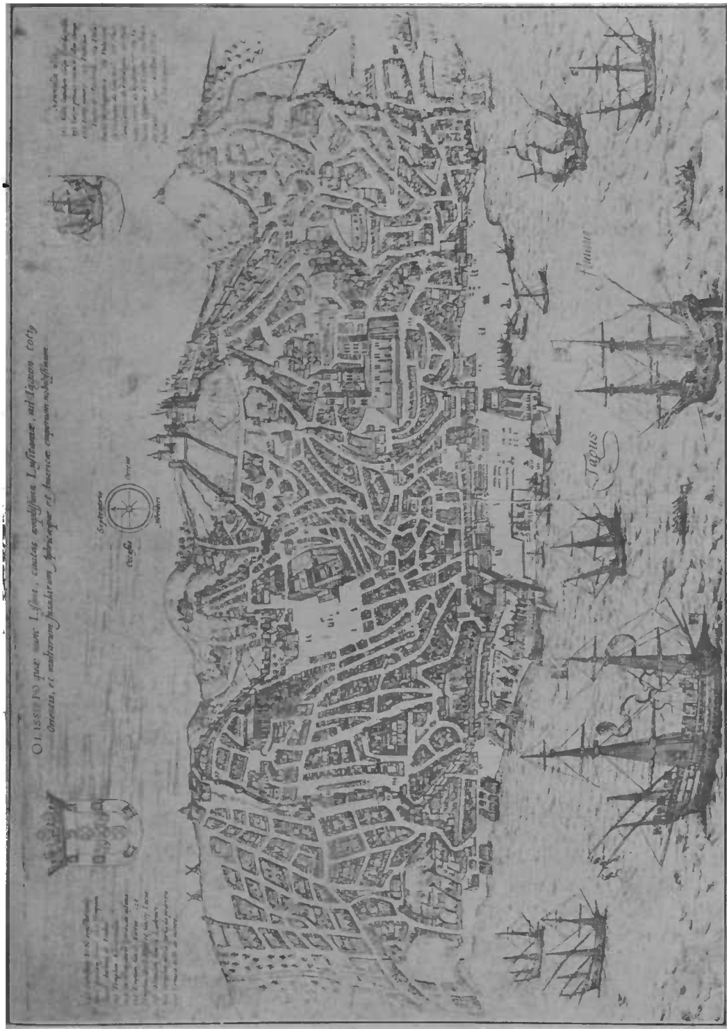
LISBOA NO SEculo XVII Segundo uma gravura da obra Urbium praecipuarum Mundi Theatrum , de Jorge Braun, de Colonia