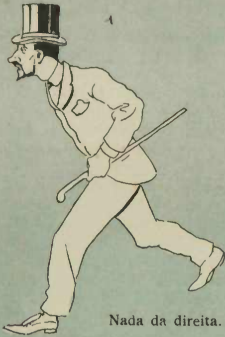
Nada da direita.

Sente-se um homem apertado , á sahida do theatro e procura um mictorio.