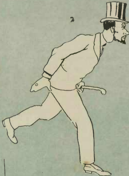
Da esquerda, nada!